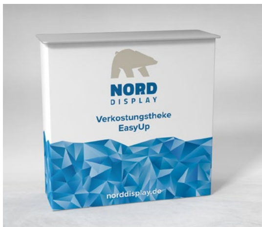
Optionales Standard Topschild