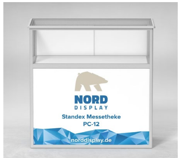
Höhe des Vitrinenaufsatzes: 30 cm