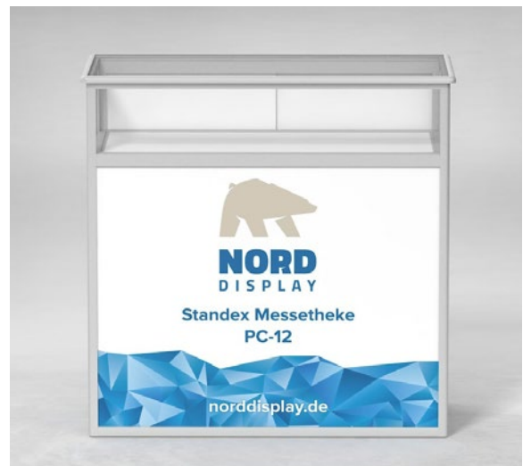
Höhe des Vitrinenaufsatzes: 20 cm